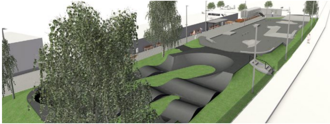
Die Skateranlage in Cuxhaven am Bahnhof soll 2022 gebaut werden

Auf rund 1.500 Quadratmetern soll am neu gestalteten Bahnhof eine Arena für Fun-Sportler entstehen. Skater, aber auch BMX-Fahrer sollen gleichermaßen ange-