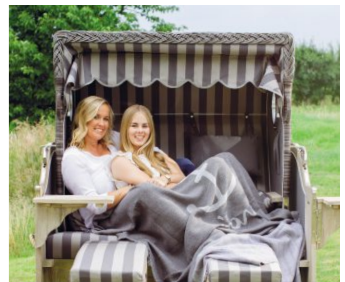
Die Strandkörbe werden möglichst nachhaltig produziert

die es uns ermöglicht, fast zu 100 Prozent mit eigenem, grünem Strom zu produzieren. Unser Fuhrpark ist zum größten Teil auf Elektromobilität umgestellt und für unsere Kunden stehen bald Wallboxen zum Laden der Fahrzeuge zur Verfügung.