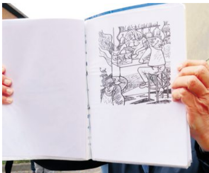
Welch ein Flair! Nicht nur Räucherduft, auch der Duft von Brathähnchen zog durch die Fahrenholzstraße

Alles in allem ein amüsanter Rundgang, der am „Pardemannschen- und früheren Alten Deichhaus endete, dessen Ursprünge sich bis 1635 zurückweisen lassen. 2005 liebevoll saniert und restauriert, zieht es mit dem alten Cuxhavener Stadtbrunnen die Blicke auf sich. Die Erinnerungen an das alte Lotsenviertel sind gewiss in den Backsteinen des alten Gemäuers gespeichert. Das einst „heiße Pflaster“ aus wertvollem Granit deckt längst der Asphalt.