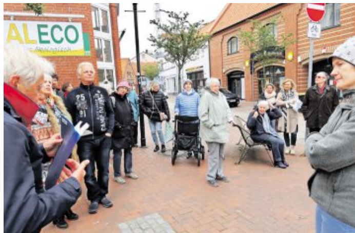
Film ab! Im Alten Deichweg, bis 1976 noch „Alter Weg“, residierten die Kammerlichtspiele - mit anfangs 500 Plätzen eines der größten Kinos in Cuxhaven

Es war die Zeit der Fischkutler und Cuxhavens Glanzzeit. Die handfesten Kerle mit der dicken Fangprämie in der Tasche liefen im Viertel ein und ließen die Puppen tanzen. Die Ehefrauen der Seeleute warteten vor dem Tor zum Fischereihafen und haben den Männern die Lohntüte abgenommen, bevor die mit einem Taschengeld zum „Heuerball“ in den Kneipen verschwanden. In der Fahrenholzstraße befand sich, gegenüber der Fischräucherei Steffens (heute Geschonke), mit