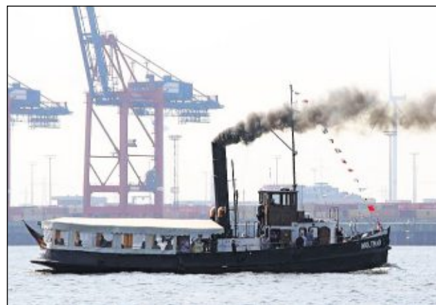
Die „Woltman“ nimmt heute auch Ausflugsgäste mit auf die Tour.

Kessel schwer beschädigt und ein Weiterbetrieb war vorerst ausgeschlossen. Es folgten Jahre der Renovierung, bis der Kessel 1992 wieder in Betrieb gehen konnte, der Dampfer wurde dann nach Hamburg in die Werft überführt und weitere Arbeiten folgten, bis er 1994 die erste Gästefahrt machte. Im selben Jahr wurde der „Förderverein Schleppdampfer Woltman“ gegründet, der den nun im Museumshafen Oevelgönne in Hamburg beheimateten Dampfer betreut. 1997 bis 2004 erfolgte dann erneut