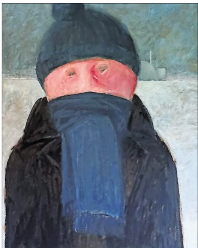
Die „vermummte“ Person vor dem Atomkraftwerk Brokdorf malte Eckert zur Zeit des Vermummungsverbotes.

Harald Eckert wäre in diesem Jahr 90 Jahre alt geworden. Nach einer Malerlehre und dem Studium an der Hochschule für bildende Künste in Hamburg arbeitete er 25 Jahre als Restaurator in Schleswig-Holstein. Nebenbei malte er viel, aber eben nur als Freizeitmaler. Schon bald nach seinem Umzug 1979 nach Freiburg/Elbe entschloss er sich, nur noch als freischaffender Maler zu arbeiten.