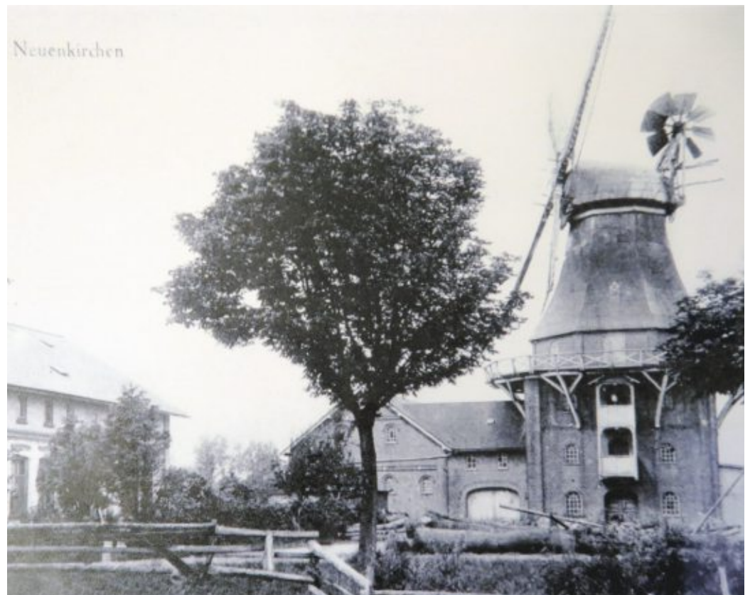
Die historische Windmühle am Ortseingang zu Neuenkirchen in ihrer glanzvollen Zeit. Heute steht noch das Mühlengebäude

Die Finanzierung des Buches wurde ausschließlich aus großzügigen Spenden und Eigenmitteln des Heimatvereines getragen. Damit war eine unabhängige Redaktion sichergestellt. Das Layout wurde durch Markus Grabsch erstellt; das Lektorat hat Holger Grabsch durchgeführt. Zunächst wird eine kleinere Auflage im Eigenverlag herausgebracht - in Hardcover-Ausführung mit 112 A 4 Seiten auf 150 g Bilderdruckpapier mit Stoffleseezeichen. Seit Ende Dezember steht es für den Verkauf zu Verfügung. Nähere Informationen unter info@hvn-neuenkirchen.de .