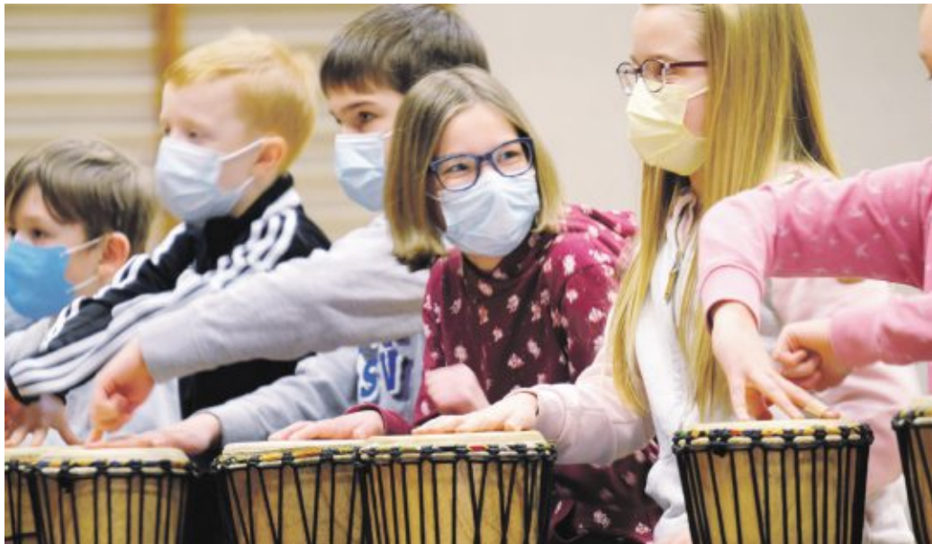
Die afrikanische Savanne hielt in der Bördehalle Lamstedt lautstark Einzug