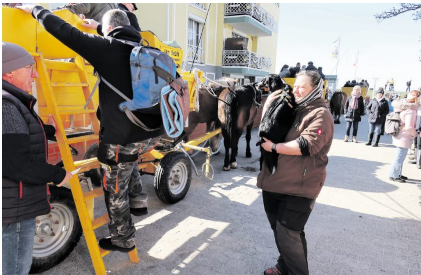
Auch „Bello“ bekommt ein trockenes Plätzchen auf dem Wagen - allerdings unter dem Sitz

Priel-Querung gibt es: Die Priel-Durchfahrt ist zwar 60 bis 70 Zentimeter flacher als die ehemalige Route. Dafür hat man jetzt sehr viel Flachwasser. „Die Watten, die sonst trocken waren, sind jetzt weitflächig mit 20 bis 30 Zentimeter Wasser bedeckt. Und der neue Weg ist 1,5 Kilometer länger. „Wenn wir viel Flachwasser haben, kann man auch mal 20 Minuten länger unterwegs sein; da kann man nicht im Trab fahren. Wir machen jetzt 45 Minuten Inselaufenthalt, nicht mehr eine Stunde wie bisher.“ Dem Spaß tut das natürlich keinen Abbruch. Das Schönste bei der Wattenfahrt ist doch immer noch die gute Schipferische Meeresluft.