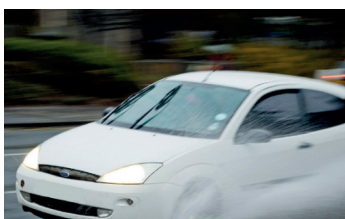
Vorsicht! Starkregen kann das Auto aus der Bahn bringen

Bei Regen sollte jeder Autofahrer besonders umsichtig sein. Es ist nicht ungewöhnlich, dass gerade eben noch die Sonne scheint und sich im nächsten Moment ein Wolkenbruch ergießt, dass die Scheibenwischer kaum dagegen ankommen. Das kann für Autofahrerinnen und Autofahrer durch Aquaplaning, Überflutungen und schlechte Sicht schnell gefährlich werden.