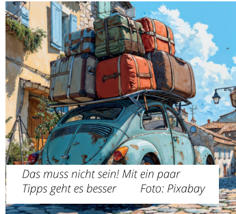
Das muss nicht sein! Mit ein paar Tipps geht es besser

Alles muss mit in den Urlaub. Familie, Kind und Kegel, vielleicht auch noch der Hund und dann das viele Gepäck. Das Einladen ist schon eine Herausforderung, denn die Ladung muss rutschsicher verstaut werden. Sonst drohen Bußgelder und Punkte. Aber das Schlimmste: Es wird gefährlich. Ordentlich und ohne Spielraum muss alles in den Kofferraum gepackt werden. Auch bei starken Brems- oder Ausweichmanövern darf nichts in Bewegung geraten.