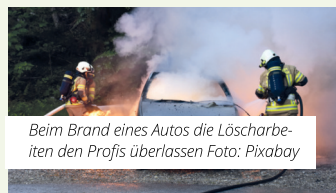
Beim Brand eines Autos die Löscharbeiten den Profis überlassen

Nach Angaben des Gesamtverbands der Deutschen Versicherungswirtschaft ist zum Glück das Risiko für einen Brandschaden relativ gering. Es liegt unter 0,03 % des Gesamtbestandes. Statistisch gesehen brennen jährlich etwa 15.000 bis 40.000 PKW, wobei viele Brände durch technische Defekte oder Wartungsmängel, und nicht durch Unfälle, entstehen. Elektroautos brennen laut Studien nicht häufiger als Verbrenner.