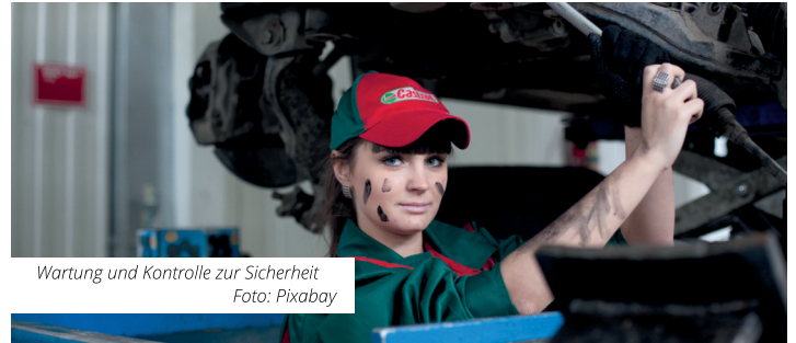
Wartung und Kontrolle zur Sicherheit

Oft versuchen Autobesitzer, mit dem sogenannten Wipptest die Stoßdämpfer selbst zu checken. Doch das ist wenig aussagekräftig. Er kann ein Hinweis sein, aber kein Beweis. Dabei drückt man ein paarmal kräftig auf die Motorhaube oder den Kotflügel und schaut, wie schnell das Auto zu schwingen aufhört. Sind die Schwingungsdämpfer in Ordnung, schwingt das Auto nur kurz und ist dann wie-