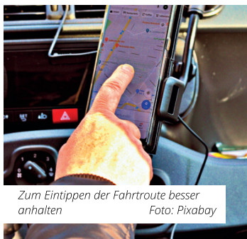
Zum Eintippen der Fahrtroute besser anhalten