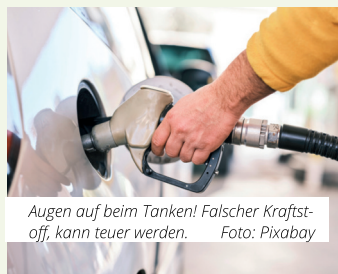
Augen auf beim Tanken! Falscher Kraftstoff, kann teuer werden.

Was dagegen unproblematisch ist: Wenn Super E10 statt E5 getankt wurde. Fast alle Fahrzeuge ab dem Baujahr 2011 sind für E10 freigegeben. Die Hinweise des Herstellers sind auf jeden Fall zu beachten. Oft reicht es aus, den Tank sofort mit einer ethanolarmen Sorte aufzufüllen, zum Beispiel Super Plus, so der ADAC.