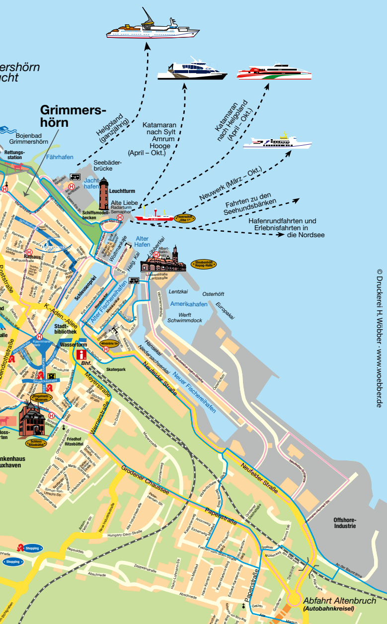
© Druckerei H. Wöbber · www.woebber.de